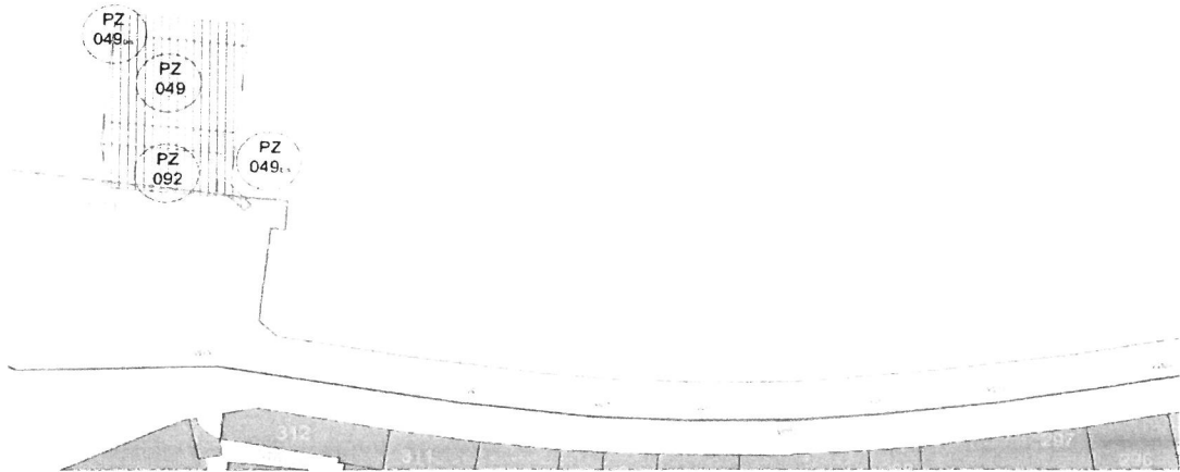
Elaborazione cartografica Modello D1 Rappresentazione con le giuste coordinate identificative dei punti costituenti le aree di concessione come espresse dai Modelli D1 depositati presso l'Ufficio dell'Ente