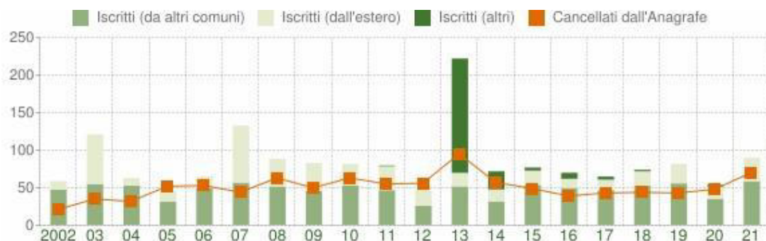
Flusso migratorio della popolazione

Il grafico in basso visualizza il numero dei trasferimenti di residenza da e verso il comune di Ponza negli ultimi anni. I trasferimenti di residenza sono riportati come iscritti e cancellati dall'Anagrafe del comune. Fra gli iscritti, sono evidenziati con colore diverso i trasferimenti di residenza da altri comuni, quelli dall'estero e quelli dovuti per altri motivi (ad esempio per rettifiche amministrative).